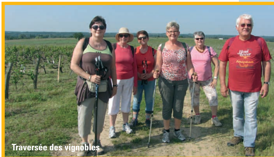
Traversée des vignobles